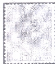
Sello de la posición IX-8

Nota: Existen catorce sellos en que la cifra no está seguida de puntos; están situados en la primera columna, posiciones I-1 a X 1, y posiciones IX-10 y X-10, todas del tipo d; y la posición II-10, de tipo b, y por falla de impresión en la cifra la posición V-9, del tipo c.