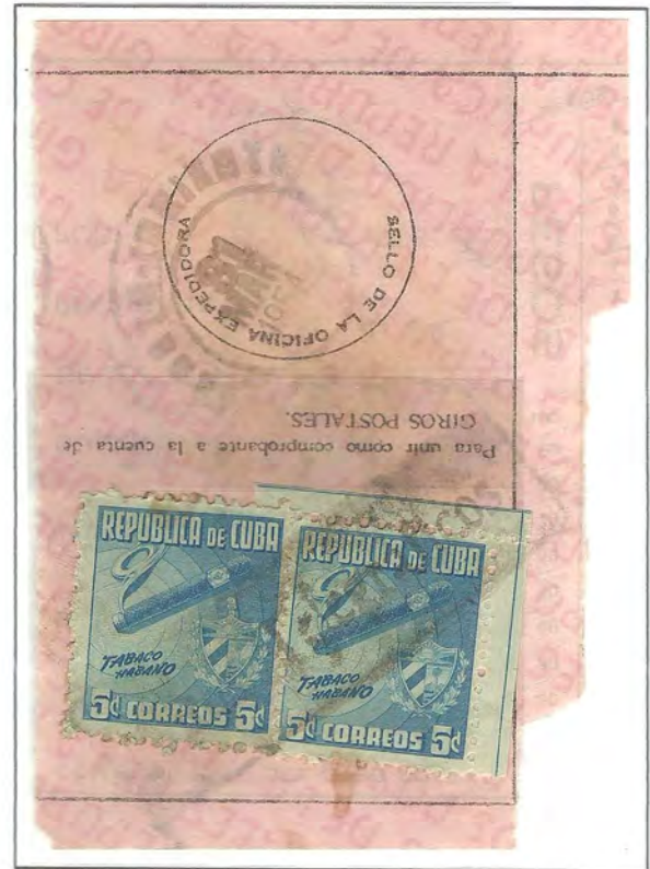
CUETO - ORIENTE