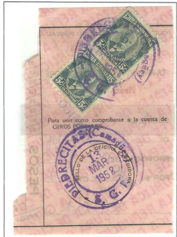
SAN GERMÁN - ORIENTE