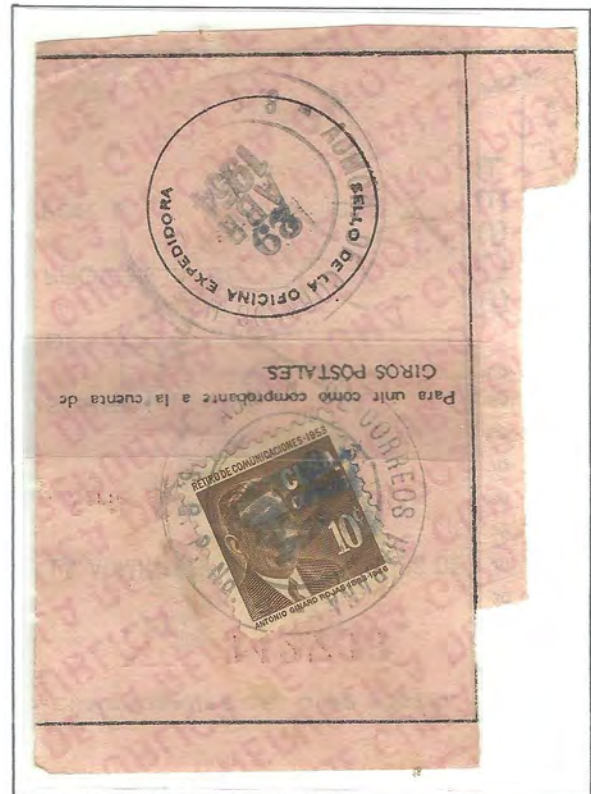
MAYARÍ - ORIENTE