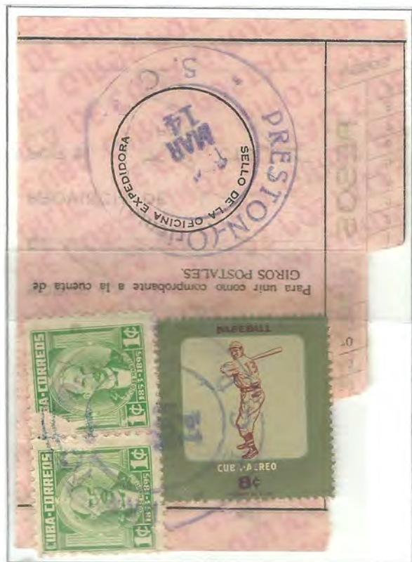
PRESTON - ORIENTE

PATRIOTAS CUBANOS 1¢ - 1954 (x2) + ACTIVIDADES JUVENILES 8¢ - 1957