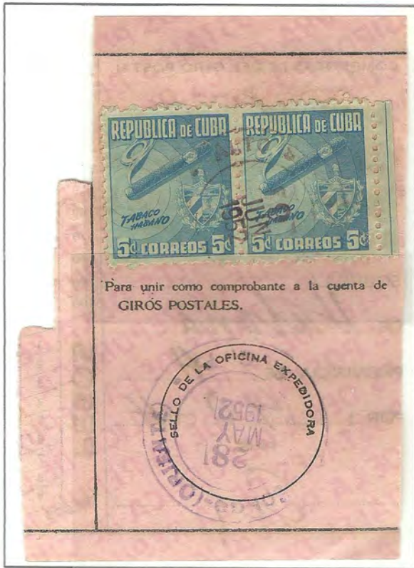
ALTO SONGO - ORIENTE

SELLO DE 5 CENTAVOS. PROPAGANDA DEL TABACO - 1950.