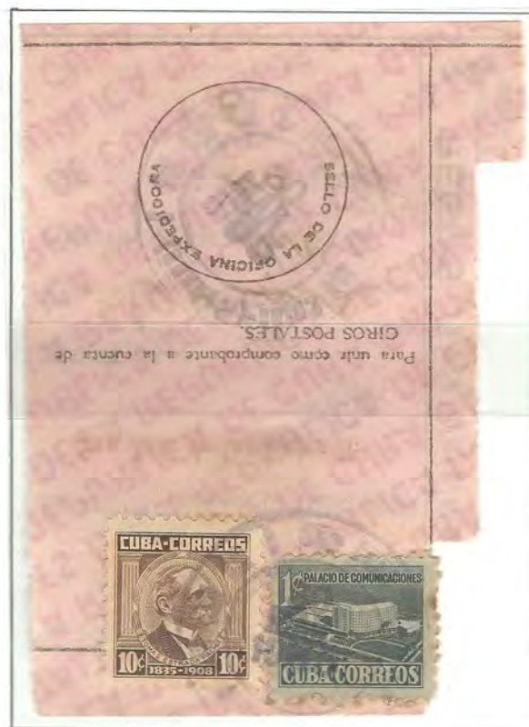
SAN JOSÉ DE LAS LAJAS - HABANA

PATRIOTAS CUBANOS 10¢ - 1954 + SOBRETASA 1¢ (INNECESARIO)