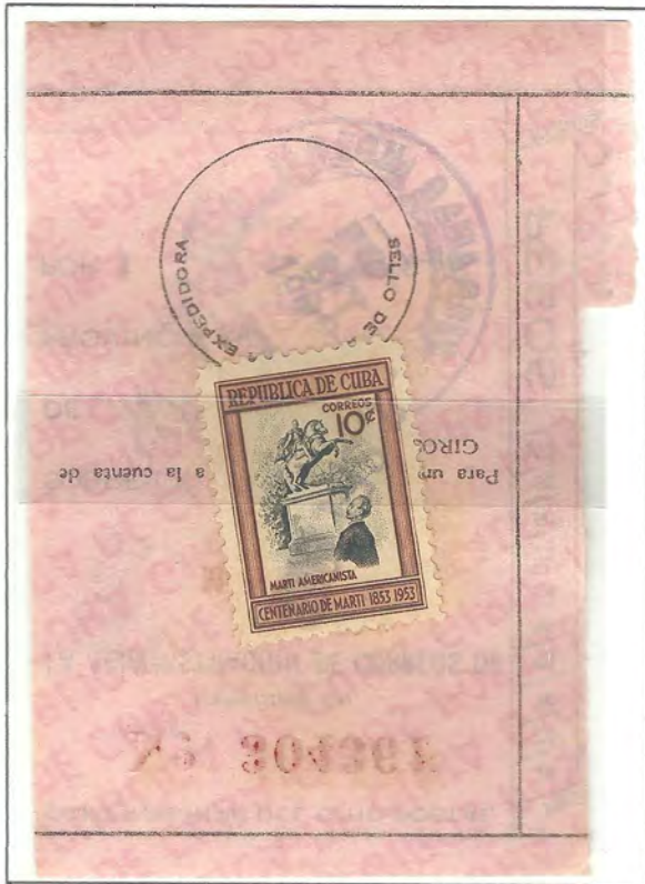
MORÓN - CAMAGÜEY

SELLO DE 10 CENTAVOS. CENTENARIO DE JOSÉ MARTÍ - 1953.