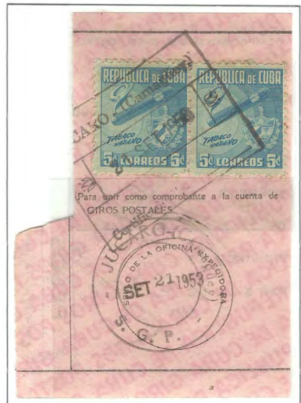
JUCARO - CAMAGÜEY