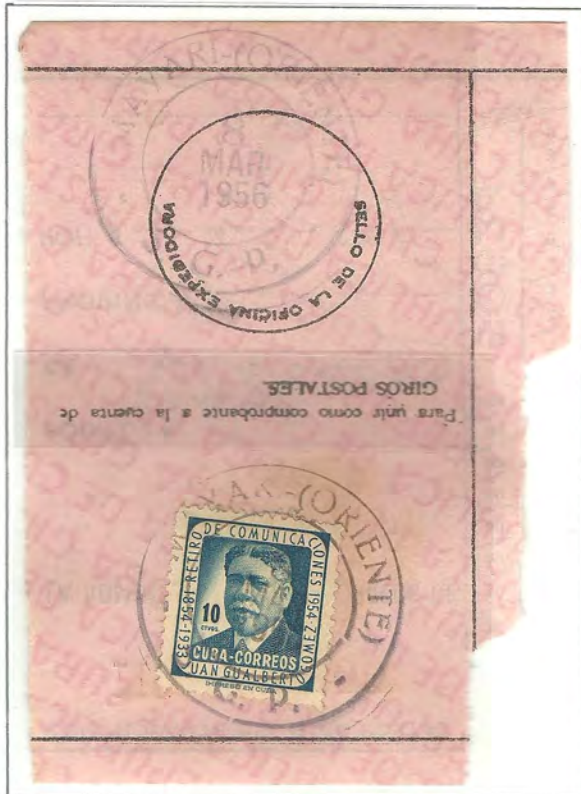
ADMINISTRACION DE LA HABANA