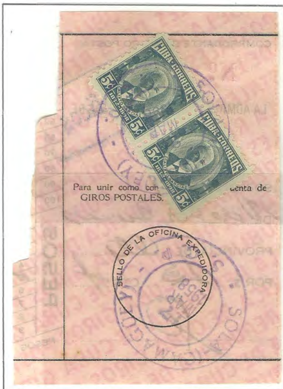
SOLA - CAMAGÜEY