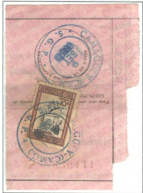
CAMAGUEY - C