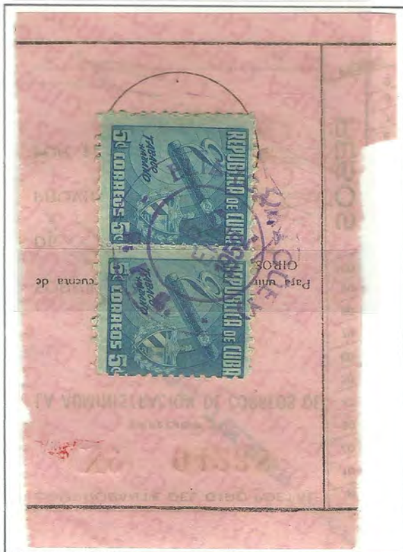
ELIA - CAMAGÜEY