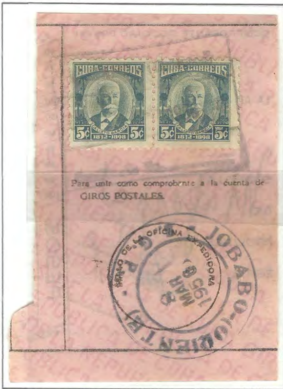
JOBABO - ORIENTE

SELLO DE 5 CENTAVOS. PATRIOTAS CUBANOS - 1954.