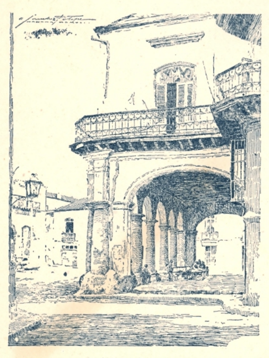
Casa del Marqués de Aguas Claras. Dibuso del arrista español Sánchez Felipe, 1923.