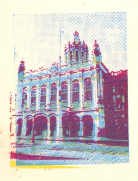
REGLA 71 13 DE MARZO SEGUNDA EXPOSICION FILATELICA DEL REGIONAL GUANABACOA