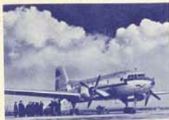
Mittelstreckenflugzeug II 14