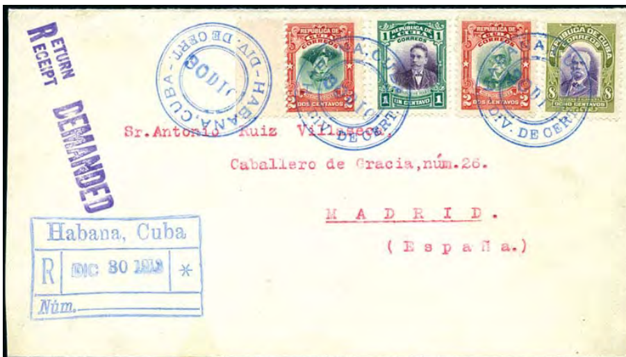
Registered coover with a 2c inverted center stamp Scott 240a. Sobre certificado con un sello de 2c con centro invertido Edifil 182ei.

Los centros invertidos en filatelia son comúnmente conocidos y tratados como los errores más codiciados. Ellos tienen una atracción similar a la de los diamantes de color. Ningún otro error en filatelia tiene una atracción igual. Ni una marca de agua invertida puede competir... :-)