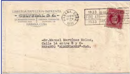
RV&Co. cover with normal perfin stamp. Sobre con un perfin normal de la RV&Co.

I have seen ten examples of the Variety 1 (the missing period, a defect that dates back to the first RV&Co. perfins of 1917) out of approximately 100 examples. This leads me to hypothesize that the company owned a perforating machine that had 10 dies, one of which had a broken pin after the "Co". (Cummins perforator machines were made with 1, 2, 5 or 10 dies.) This would statistically yield a 10% chance of encountering this RV&Co variety.