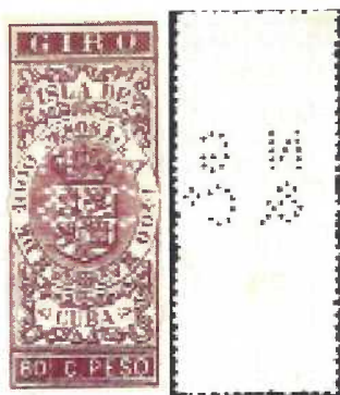
1896 Cuban giro revenue stamp (Wm McPherson Jones catalog No. CA195) with NG&Co perfin. Sello cubano de Giro de 1896 (Wm. McPherson Jones catalog No. CA195) con el perfin NG&Co

Eso me llevó a buscar en el siguiente lugar más lógico: Cuba. Empezé con una búsqueda en el Internet y por casualidad me topé con un directorio comercial cubano del año 1896. En toda la isla de Cuba solo había una compañía